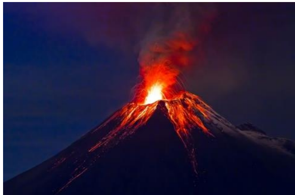
Emissions volcaniques et industrielles