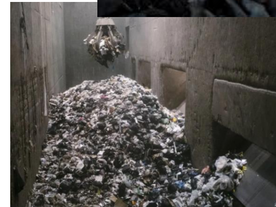
incinération déchets combustion de charbon et produits pétroliers 9