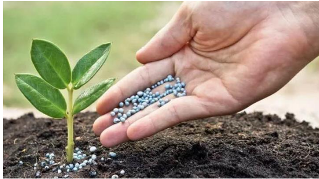
Emploi engrais phosphatés